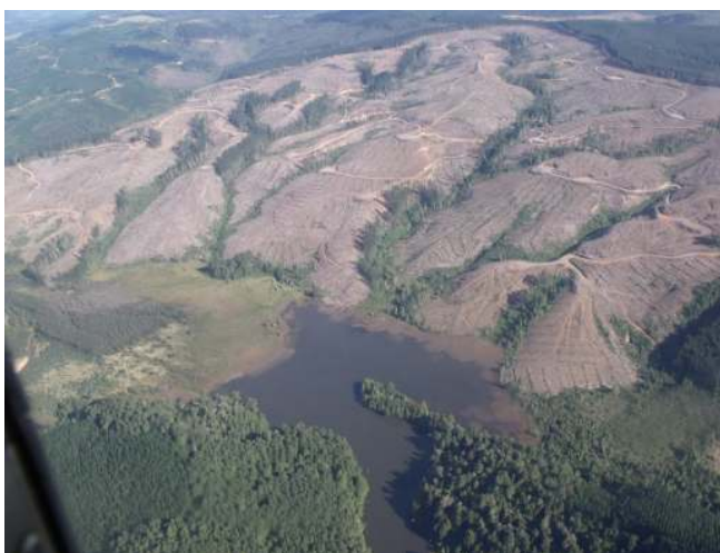
Talas rasas de extensas superficies, sin respetar la protección de cursos de agua