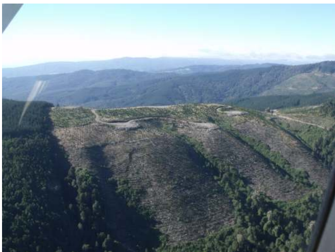
Cosecha de plantaciones en áreas con alta pendiente