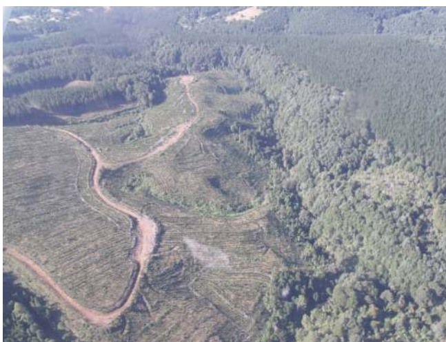
Sustitución de bosque nativo