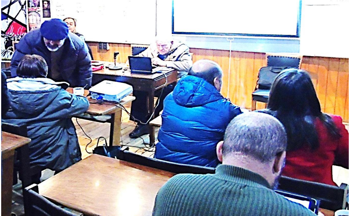
François Houtart en la Escuela Política Urracas, junio 2015

En Junio del año 2015 las Urracas Emaús Chile realizamos una Escuela Política con la participación de más de 50 delegados de grupos de Emaús de América y Europa y amigos de Chile.